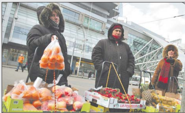
Будьте осторожны: фрукты с токсинами

Борьба с несанкционированной торговлей в районе ведется давно. Ежедневно в депутатском зале Киевского вокзала собирается оперативный штаб, координирующий деятельность различных ведомств, занимающихся ликвидацией стихийных торговых точек. В него входят представители управы района Дорогомилово и ОВД, ЛОВД на Киевском вокзале и ГИБДД по ЗАО, Административно-технической инспекции и метрополитена, железнодорожных структур и транспортных компаний, администрации Киевского вокзала и даже торговых центров «Европейский» и «Китеж». По его инициативе была оптимизирована схема движения автотранспорта по площади вокзала, нанесена разметка, пресекаются попытки самовольной установки столбиков-ограждений, за которыми могут прятаться негодяи-нелегалы.