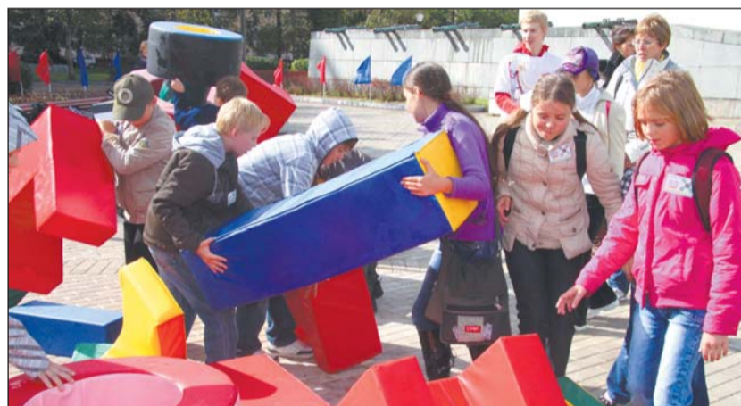
Построить оборону крепости — задача не из легких