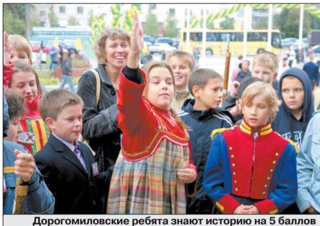
Дорогомиловские ребята знают историю на 5 баллов