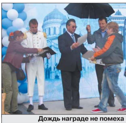
Дождь награде не помеха