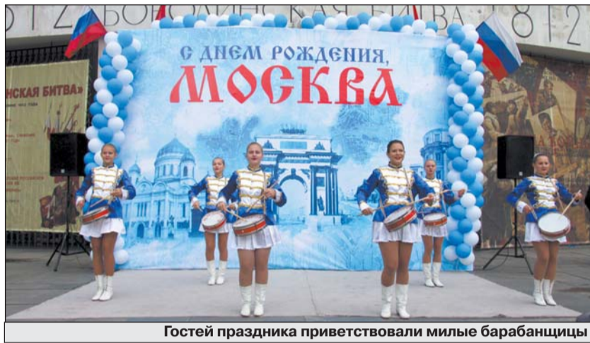
Гостей праздника приветствовали милые барабанщицы