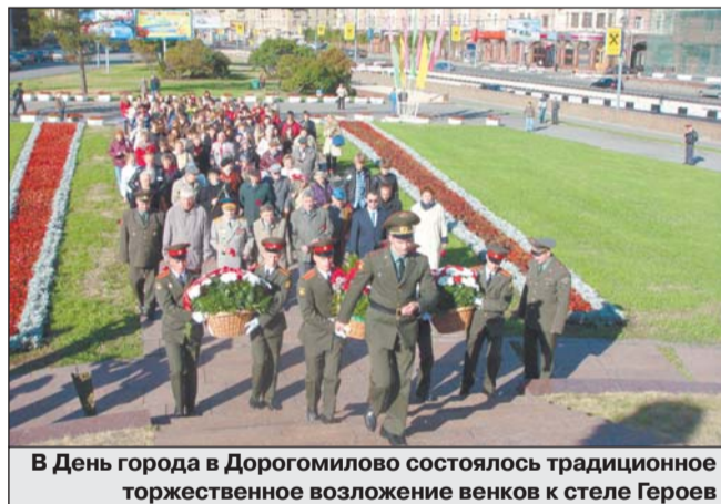
В День города в Дорогомилово состоялось традиционное торжественное возложение венков к стеле Героев