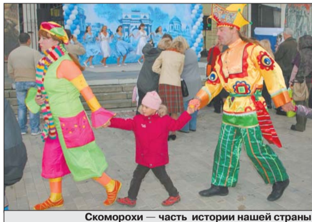
Скоморохи — часть истории нашей страны