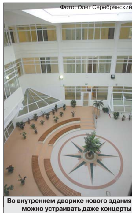
Во внутреннем дворике нового здания можно устраивать даже концерты

тренных стен), а уже 15 апреля завершено 90 % монолита. То есть полностью построена коробка будущей школы. К этому времени численность строителей превысила 300 человек. 15 мая устанавливались окна, наружные витражи, освещение и уже начали работы по благоустройству территории. Далее по нашей просьбе число рабочих было увеличено, и основные внутренние инженерные системы и отделку делали уже 400 человек. Заканчивали бригадой в 500 специалистов. Результат усилий очевиден: счастливые дети, родители и учителя, благодарная общественность. Ведь новая школа полностью вписалась не только в традиционную архитектуру Дорогомилово, но и в совре-